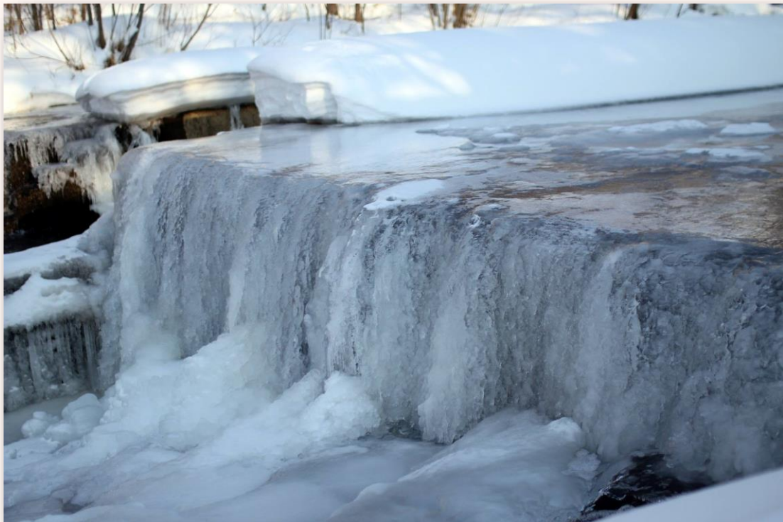
寒さで凍った滝

また、スキー場など特別な場所に行かなくても、冬ならではの景色を楽しむことができます。いつもの散歩道が真っ白になり、小さな川や滝は凍って、きらきら光ります。いろいろな動物の足跡を追ってみるのも楽しい時間です。