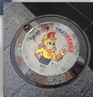
自転車の使い方や喫煙の ルールを守るお願い (千葉県柏市)