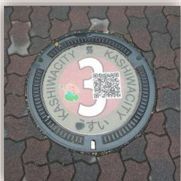
QRコードつき (千葉県柏市)