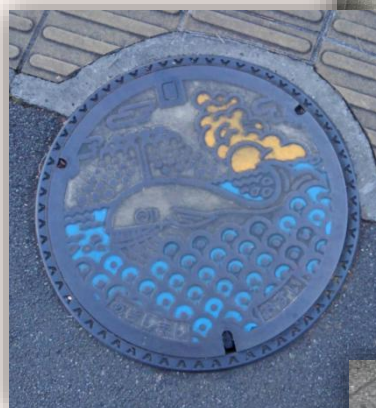
アキシマクジラ (東京都昭島市)