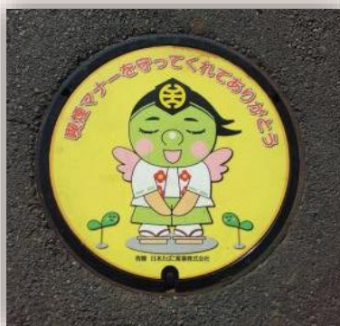
喫煙のマナーを守ってくださるありがとうございます (東京都八王子市)