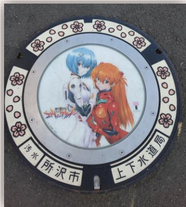
しんせい き 新世紀エヴァンゲリオン (埼玉県所沢市)