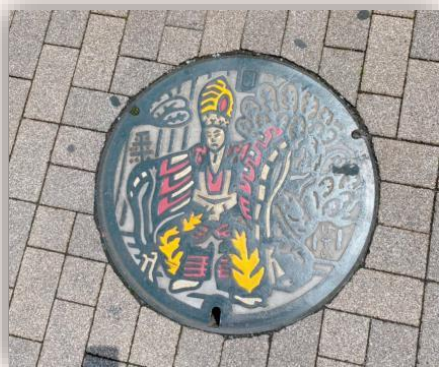
はちおうじ くるまにんぎょう 八王子車人形 (東京都八王子市)