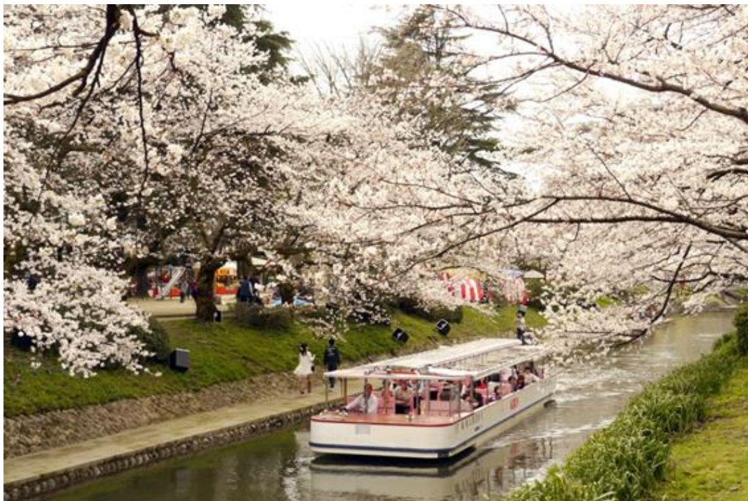
まつかわ さくら 松川の桜

( https://toyama.visit-town.com/toyamastyle/matsukawa )