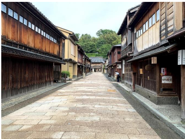
町家がたくさんある金沢・ひがし茶屋街

2020年の今、日本は少子高齢化が進み、人口は減りつつあります。人口の減少とともに、空き家がとも増えています。今、日本にある家の1/8が空き家です。若い人たちがいいと思う家は、10年経つとその価値が半分になり、30年後は0円になります。家に価値がないので、どんどん壊されて大きなゴミになります。そのゴミは山の中に捨てられ、家が壊されて何もなくなった土地にまた新しい家が建てられているのです。