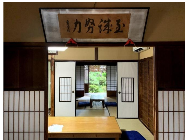
町家の中