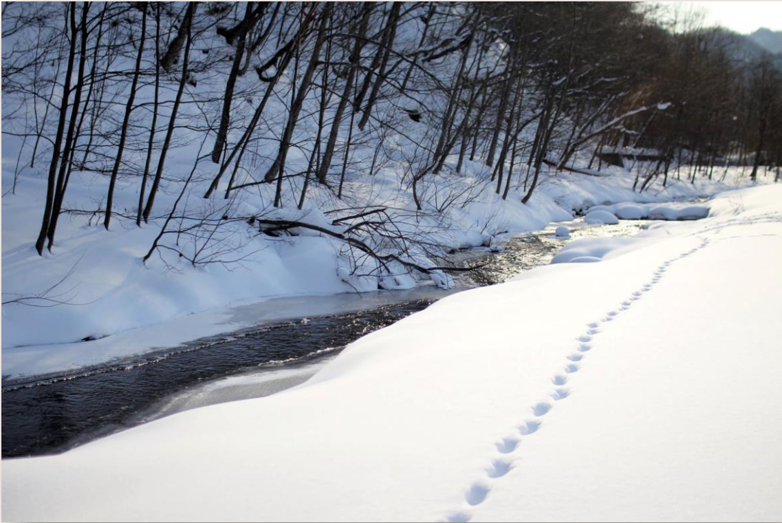
どうぶつ あしあと ひっそりきつえい 動物の足跡

さっぽろ まるやまこうえん 札幌にある円山公園というところでは、 すうねんまえ ゆき つく どうぶつ わだい 数年前から、雪で作られた動物たちが話題 になっています。いろいろな木に、かわい き いうさぎやりすがいます。これは公園の近 こうえん ちか くに住んでいるデザイナーさんがつく す っているそうです。