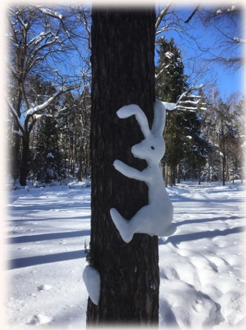
ゆき つく たうさぎ ひっそりきつえい 雪で作られたうさぎ

ゆき く らすことは、たの 雪と暮らすことは、楽しいことばかりで はありません。おおゆき ひ 大雪の日はバスや電車が止 でんしゃ と まる